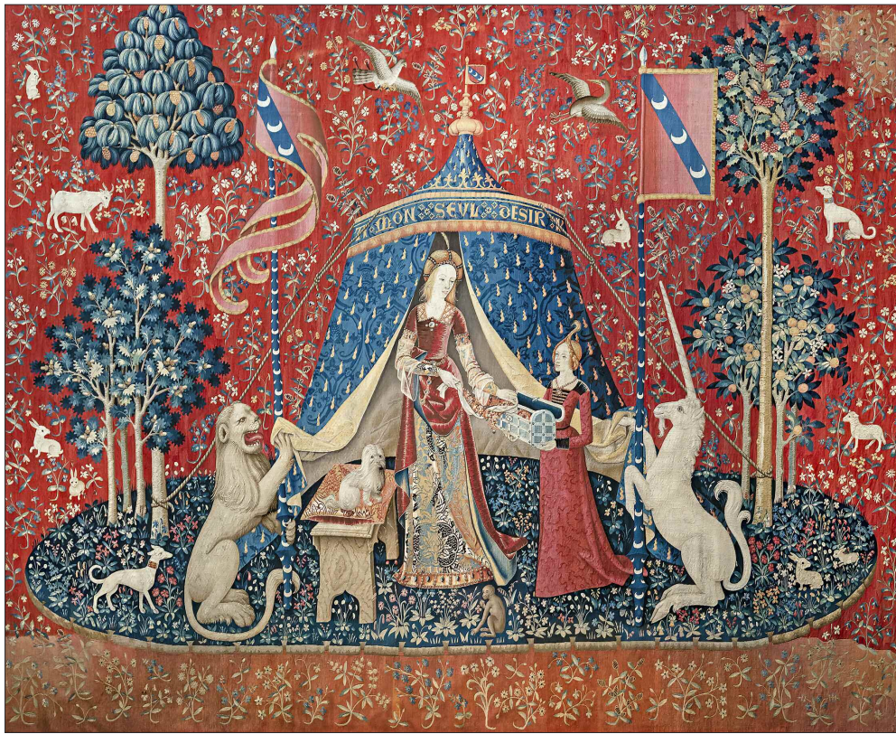
Figure del desiderio